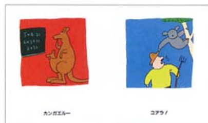
『だじゃれどうぶつえん』 (絵本館)