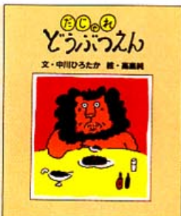
「だじゃれどうぶつえん」(絵本館)