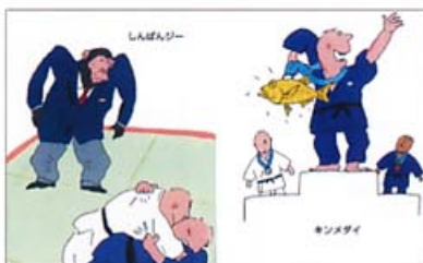
『だじゃれオリンピック』 (絵本館)