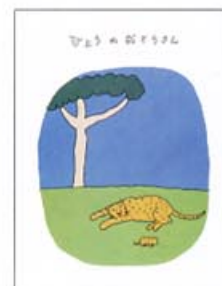
『おとうさんのえほん その2』 (絵本館)