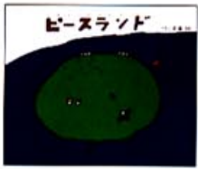
「ピースランド」 (絵本館)

1981年に出した『ピースランド』です。 トピカルな絵本、のんびりした絵本を創 りたいと思いました。原画はシルクスク リーンで仕上げました。この絵本は、ワ コールのショーツやJTBのポスターに も使われたのですが、この絵本が今のぼく の原点です。